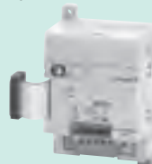
CPM1A-DRT21 Входные данные: 32 бит Выходные данные: 32 бит