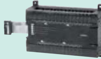
CP1W-20EDT Входы постоянного тока: 12 Транзисторные выходы (NPN): 8