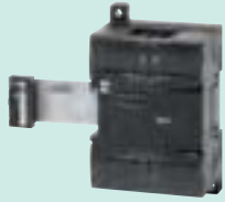
CP1W-8ED Входы постоянного тока: 8