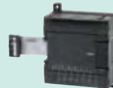
CP1W-TS001 Входы терморпар: 2