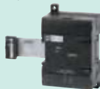
CP1W-SRT21 Входные данные: 8 бит Выходные данные: 8 бит