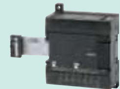
CP1W-MAD44 Входы: 4 (разрешение 12 000) Выходы: 4 (разрешение 12 000)