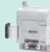
CPM1A-PRT21 Входные данные: 16 бит Выходные данные: 16 бит